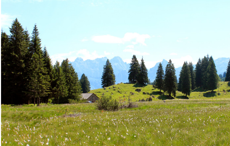
Hochmoor im Schwändital

Eines der zahlreichen nationalen Klimaschutzprojekte von myclimate unterstützt die Renaturierung von Hochmooren. Durch diese Wiedervernässung gelangt nicht nur weniger Treibgas in die Atmosphäre. Zusätzlich werden auch Biodiversität und der natürliche Wasserhaushalt gefördert. Als weiteres Klimaschutzprojekt von myclimate fördern wir die klimaoptimierte Bewirtschaftung von Schweizer Wäldern, damit CO 2 gespeichert werden kann. Entsprechend werden Klimaschutzprojekte kontinuierlich gefördert und ausgebaut.